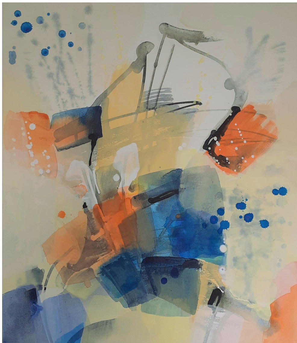
1 Sans titre , 2022, 63 x 73 cm, acrylique sur toile