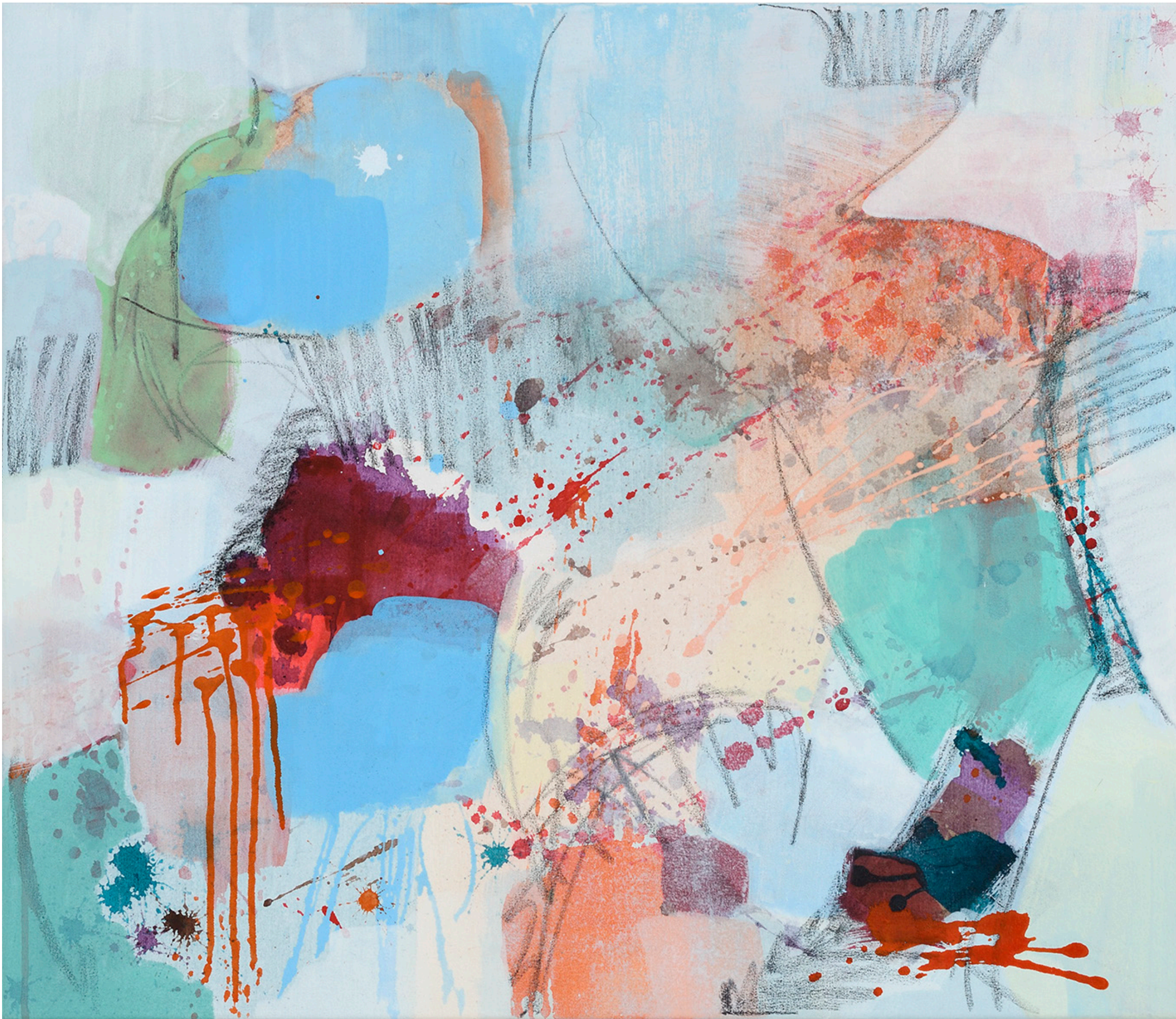
1 Sans titre , 2023, 63 x 73 cm, acrylique et graphite sur toile, photo Dorian Rollin