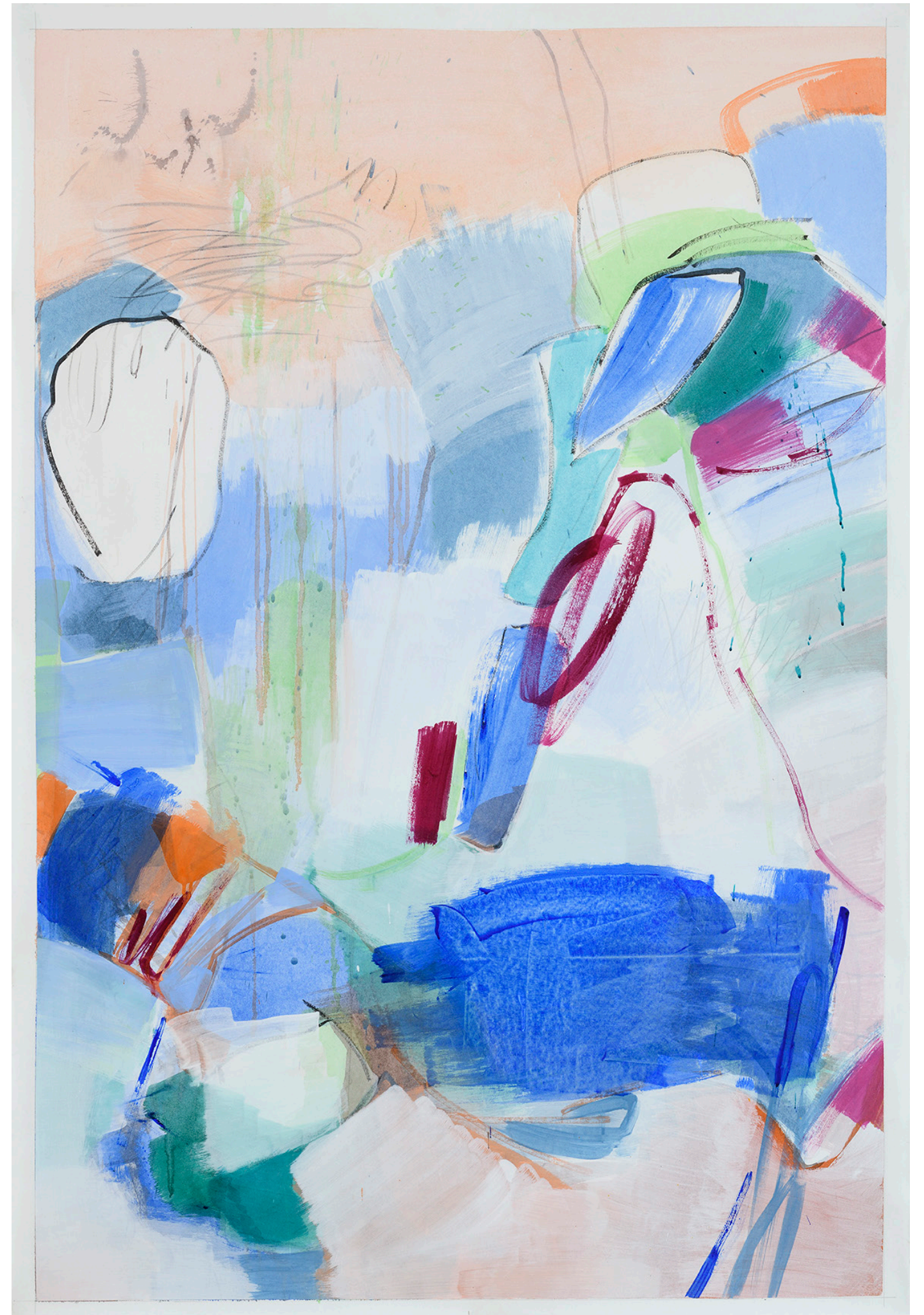
1 Chapeau ! , 2023, 100 x 150 cm, acrylique sur toile de rénovation, photo Dorian Rollin