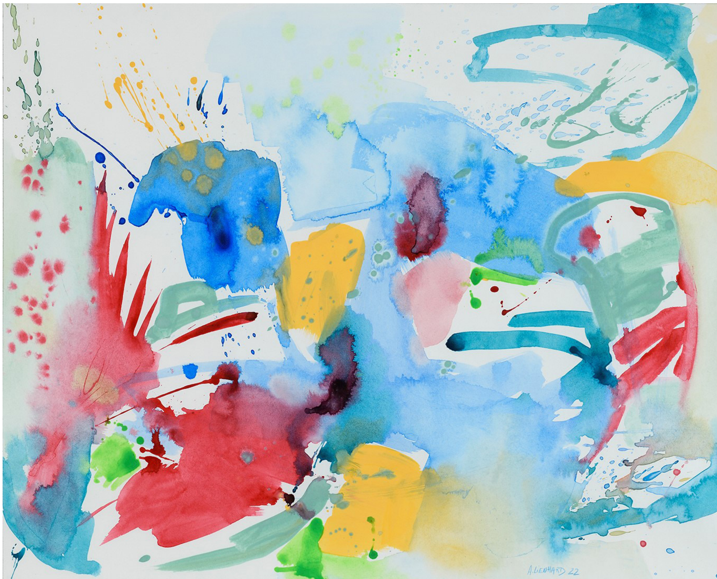
1 Bientôt l'été , 2023, 80 x 100 cm, acrylique et encre sur toile de rénovation