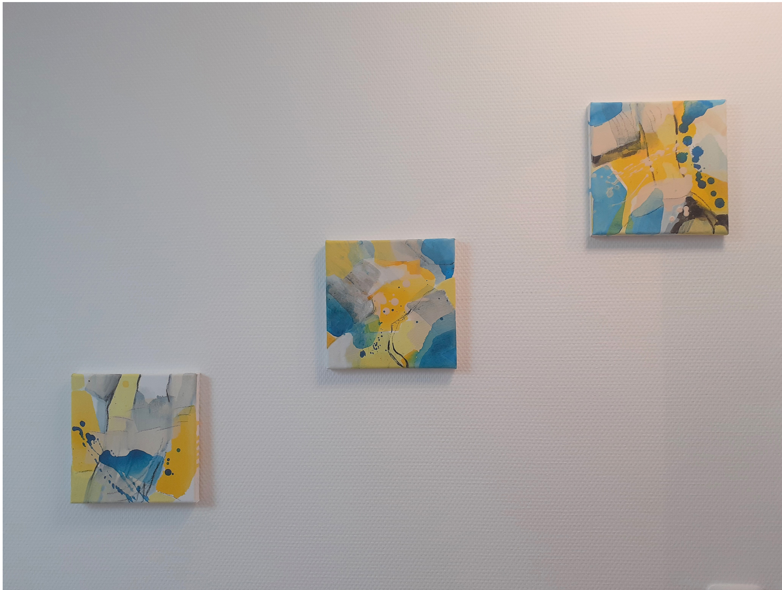
1 Jaune et bleu, triptyque 1 , 2021, (3 x) 20 x 20 cm, acrylique et fusain sur toile, photo Aurélie Lienhard