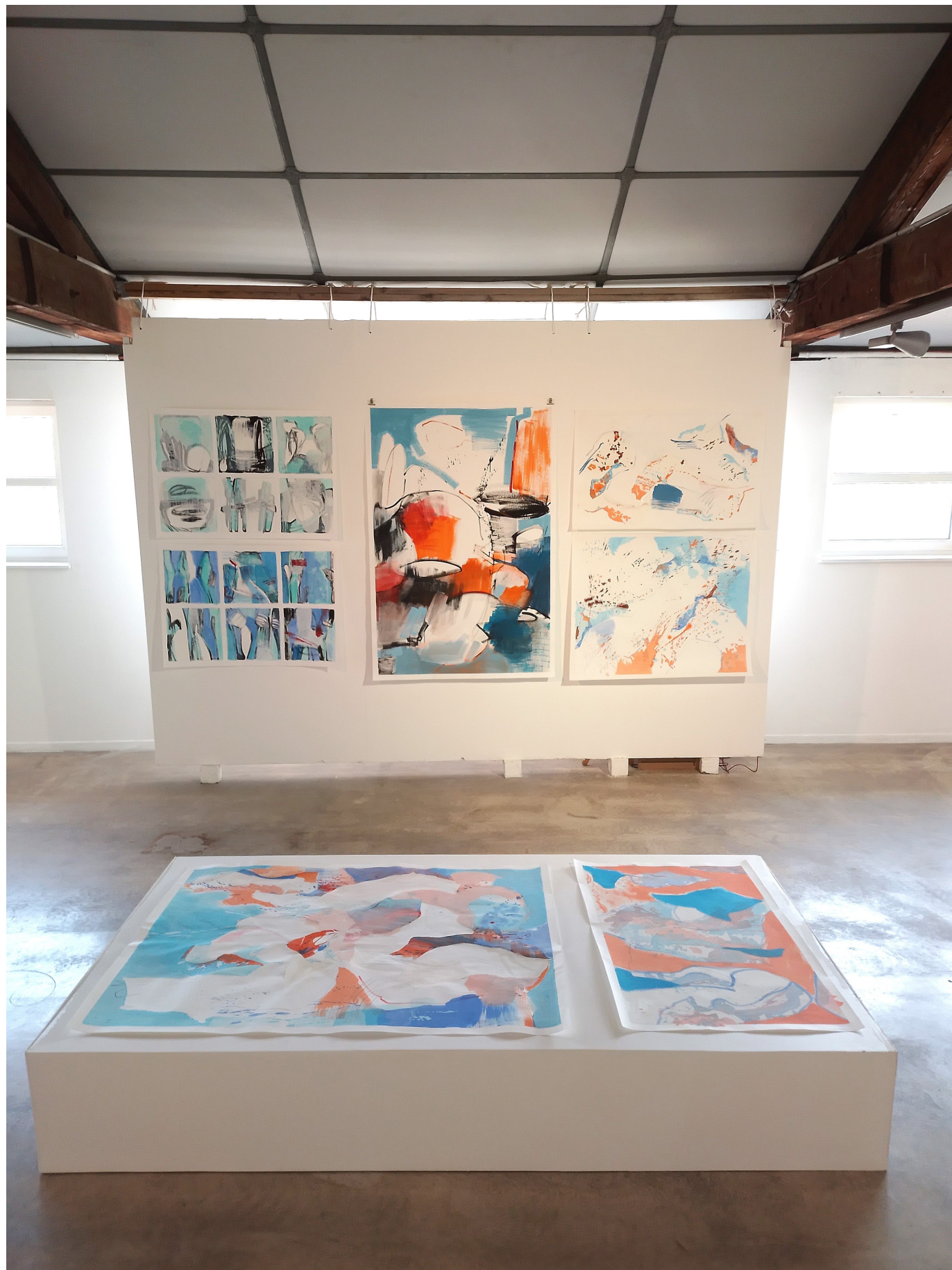
1 Vue d'exposition : J'annonce la couleur , Le Séchoir, Mulhouse, 2023