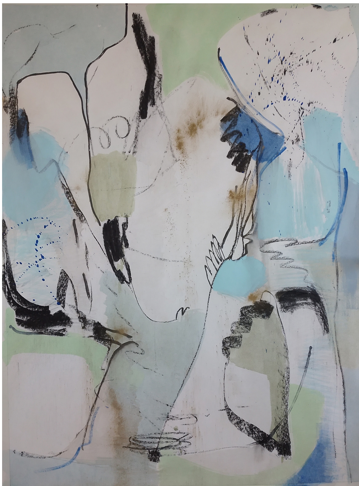
1 BD Mood , 2023, 100 x 134 cm, acrylique, fusain, poudre de cuivre sur toile de rénovation