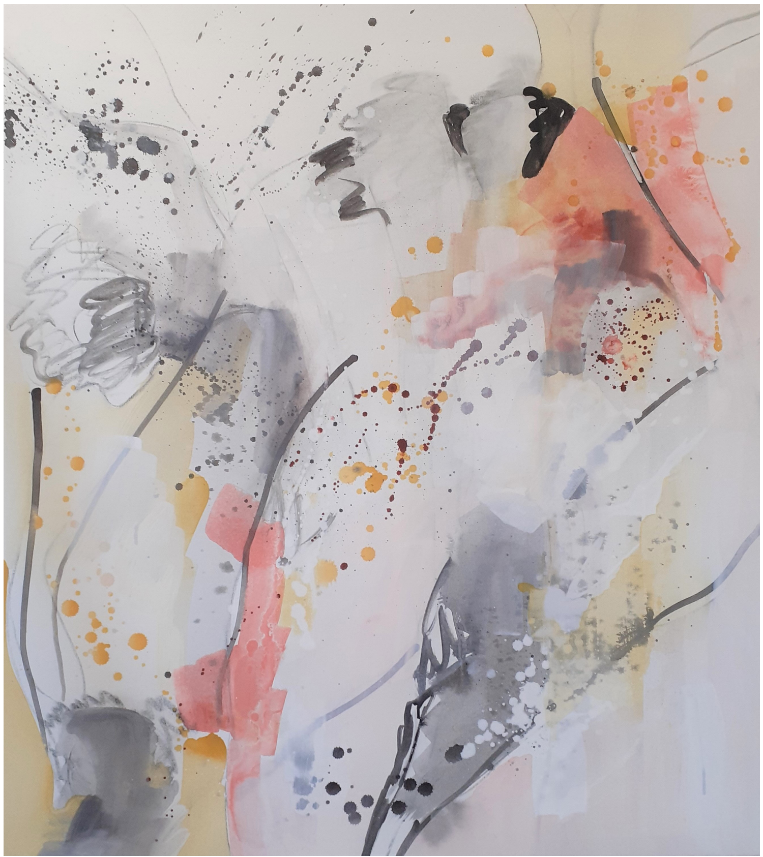
1 Sans titre , 2021, 110 x 120 cm, acrylique et encre sur toile, photo Aurélie Lienhard