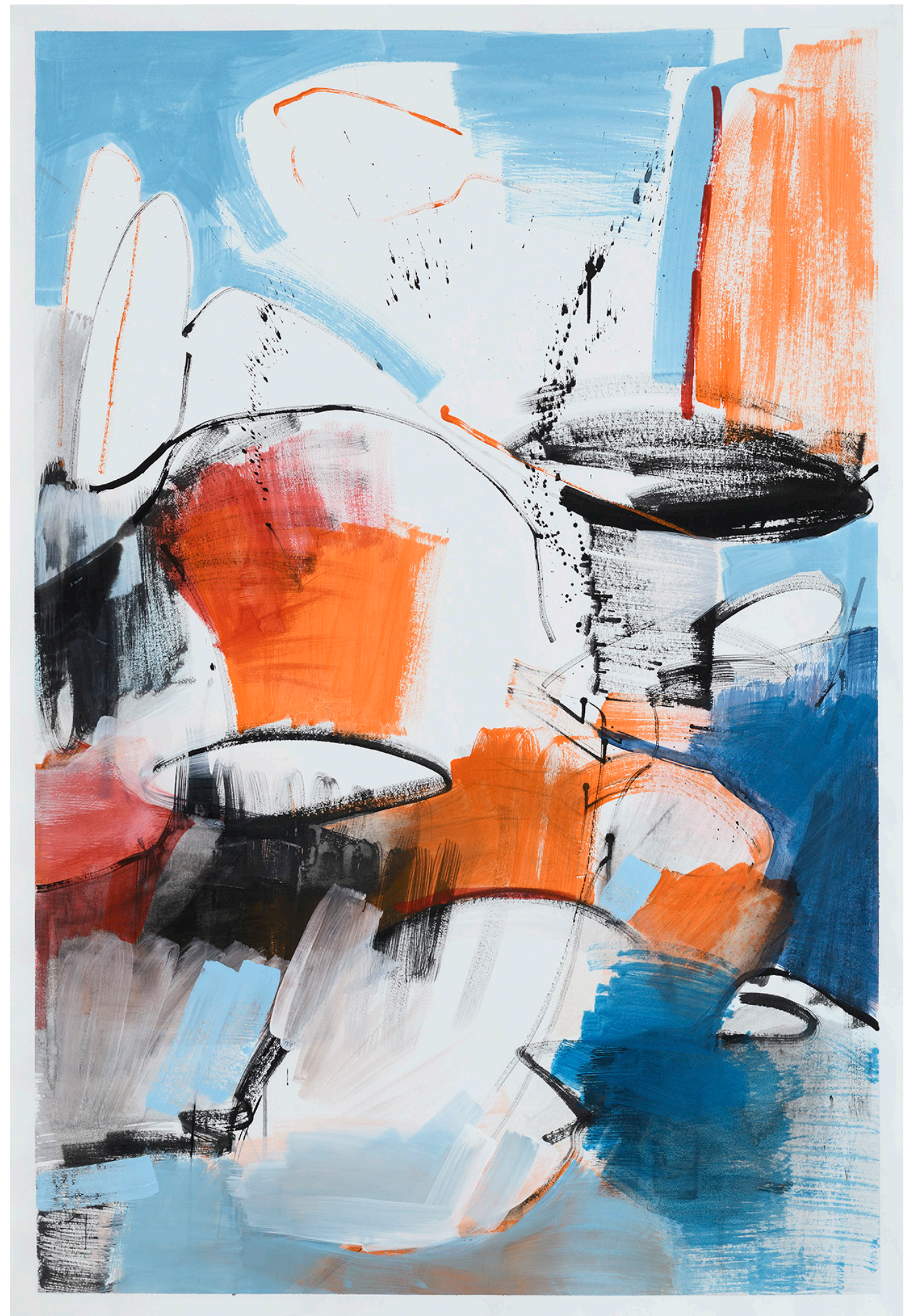
2 Sans titre , 2023, 100 x 150 cm, acrylique sur toile de rénovation, photo Dorian Rollin